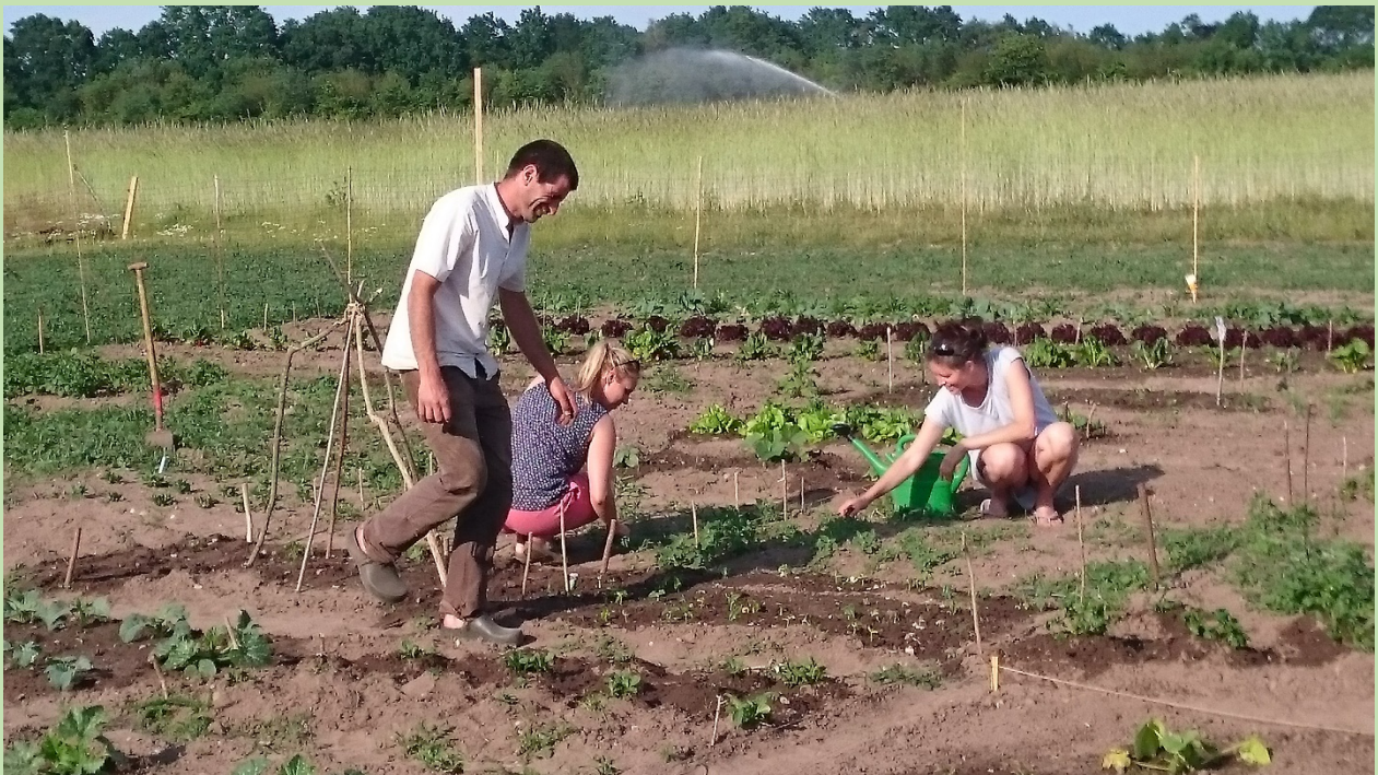
Ackern macht dreckige Hände und lachende Herzen

Wenn ihr eine Ackerparzelle auf dem Arpshof für die Saison 2019 mieten wollt, wendet euch an: Bertil Huth: 04186 - 889 227 info@bio-hoeker.de www.bio-hoeker.de